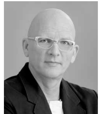
Dr. Kjell A. Nordström Management Mastermind et auteur de best-sellers / Management Mastermind und Bestsellerautor