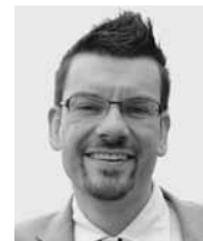
Pour le comité organisateur / Für das Organisationskomitee