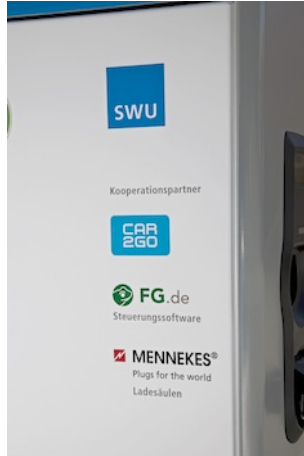
Die Ladesäule mit Hinweis auf die Kooperationspartner