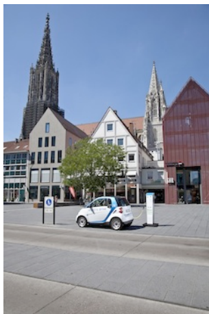
Stromtanken vor dem ServiceCenter Neue Mitte mit Blick auf das Münster