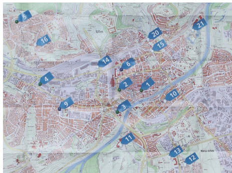
Stadtkarte mit Stromtankstellen im Kerngebiet Ulms