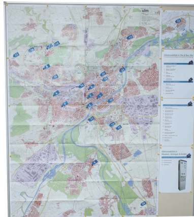
Legende zu Stadtkarten mit Ausbauphasen