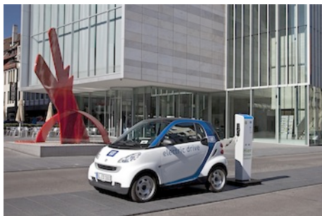
Lautlos, emissionsfrei und komfortabel unterwegs mit dem car2go-Elektro-smart