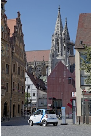
Ulm ist Vorreiter der Elektromobilität