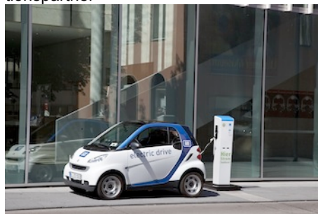
Künftig fester Bestandteil des Ulmer Stadtbildes