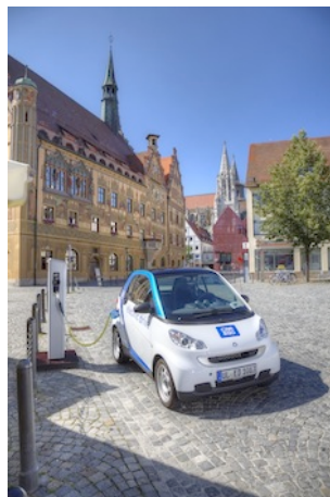
Tradition und Zukunft: Ladesäule vor dem historischen Rathaus Ulms