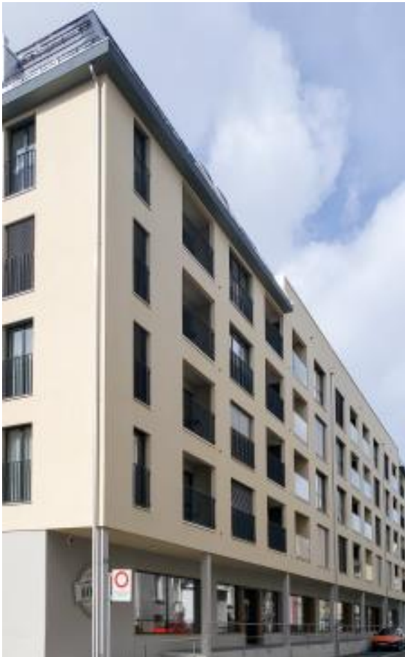
Mit über 50 Apartments hat das Boarding House in St. Gallen einen ähnlichen Warmwasser-Verbrauchsprofil wie ein Hotel. Entsprechend großzügig ist der Wärmespeicher der Heizzentrale ausgelegt.