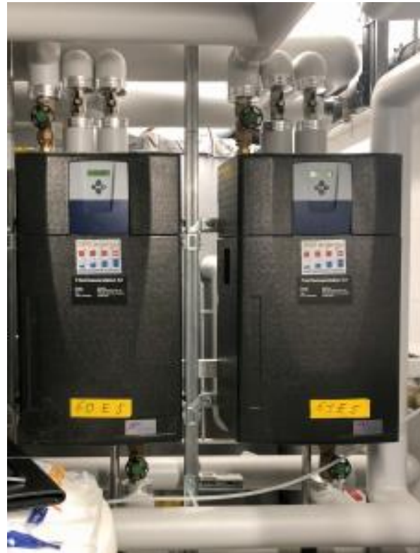
Zwei der drei Frischwasserstationen, welche die Wohnungen und den Spa-Bereich sowie die Bäckerei mit Warmwasser bedienen