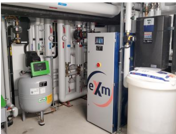
Dank der eXergiemaschine (Mitte) lässt sich Abwärme der Bäckerei, die von deren Kälteanlagen erzeugt wird, für das Heizen und die Warmwasserbereitung verwenden.