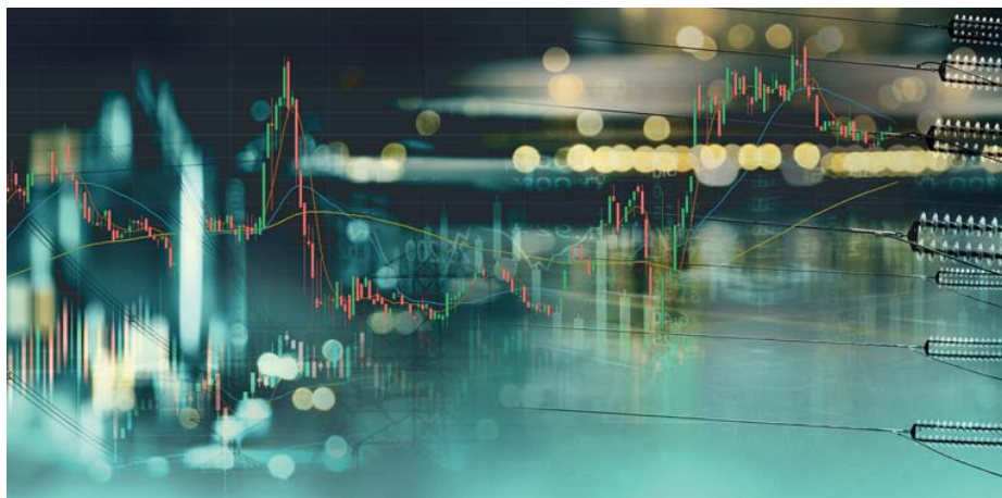
Die Volatilität zeigt in den Energiemärkten ihren freien Lauf.